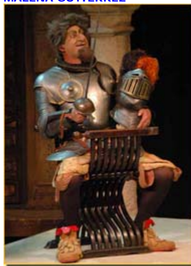
FÉLIX CASALES